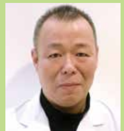
公益財団法人中国労働衛生協会 米子検診所 診療所長

ディスバイオーシスが引き起こす最も身近な症状は下痢や便秘ですが、近年の研究により様々な病気に関わっていることが分かってきました。ディスバイオーシスは腸の病気（大腸がん、潰瘍性大腸炎、過敏性腸症候群）のほかに肝炎、肝臓がん、糖尿病、肥満、動脈硬化、心不全、アレルギー、多発性硬化症など様々な病気のリスクを高めることが分かっています。ではディスバイオーシスにならない