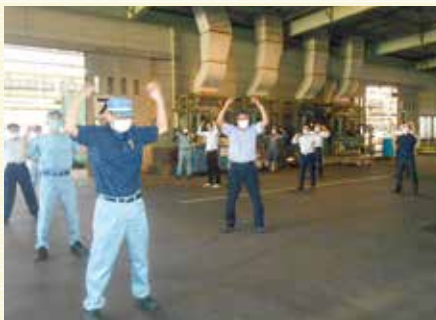
株式会社シーケイエス・チューキ 福山市箕島町6280-10

コロナ禍で、スポーツイベント(年2回のボーリング大会)や昼休憩の卓球の中止など、思うようにいかないことも多い状況ですが、従業員が元気で楽しく会社生活を送れるように、取り組みを続けていきたいです。