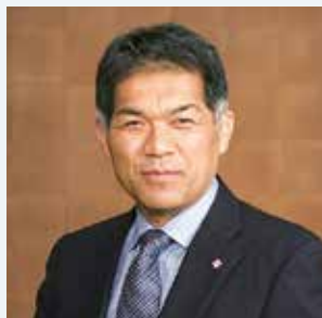
医療法人 まさよし会 児玉クリニック