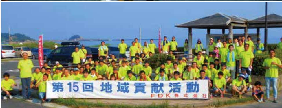
上/鳥取しゃんしゃん祭で「しゃんしゃん傘踊り」披露するFDK(株)鳥取工場の社員たち。例年は8月に開催。 下/浦富海岸の清掃活動を毎年続けている。昨年と今年はコロナ禍で自粛。写真は2019年のもの。

今春、FDK(株)鳥取工場は生産ラインを3割増強した。ガスメーターや火災警報器用途の円筒リチウム二次電池の需要が急速に拡大しているためだ。