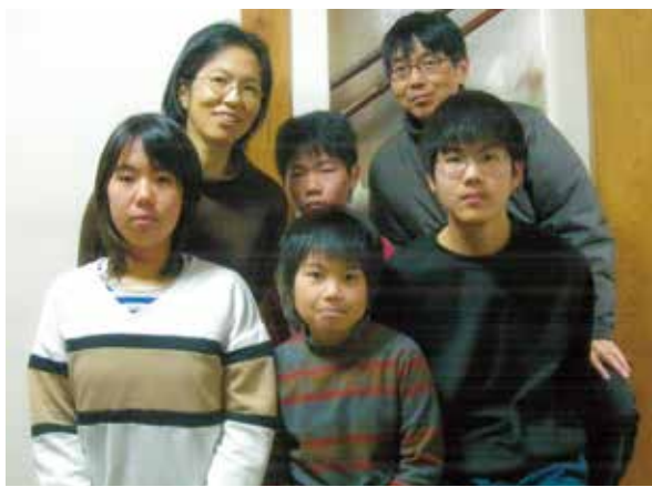
上/4人の子どもと夫とともに。左/ THE ALFEEのCDとグッズ類。